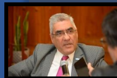
TUCUMÁN: Una mesa de trabajo busca estrategias para solucionar faltantes

https://www.comunicaciontucuman.gov.ar/noticia/economia-produccion/241173/ mesa-trabajo-busca-estrategias-para-solucionar-faltante-gas-industrias