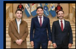
GOBERNADORES: Se unen para impulsar producción y agenda federal

https://cholilaonline.ar/2026/05/gobernadores-agenda-federal-productiva-argentina.html