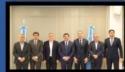
GOBERNADORES: Santilli se reunió con gobernadores en San Juan

https://www.argentina.gob.ar/noticias/santilli-se-reunio-con-gobernadores-en-san-juan